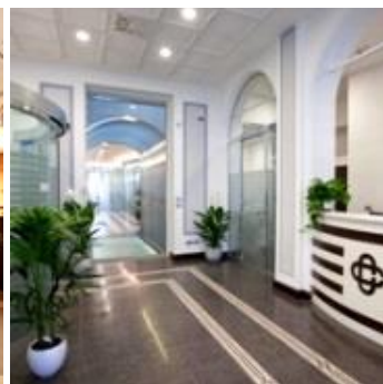
FILIALE BCC ALTO RENO Porretta Terme (BO)

COVILIARTE NEWSLETTER Via Isonzo 1 • 41026 Pavullo nel Frignano (MO) Info: +393389250232 • Web: www.coviliarte.com