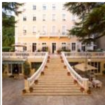
HOTEL HELVETIA THERMAL SPA Porretta Terme (BO)