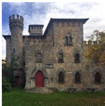
CASTELLO MANSERVISI Castelluccio (BO)

LE 4 SEDI ESPOSITIVE DELLA MOSTRA: "COVILI • visionario resistente"